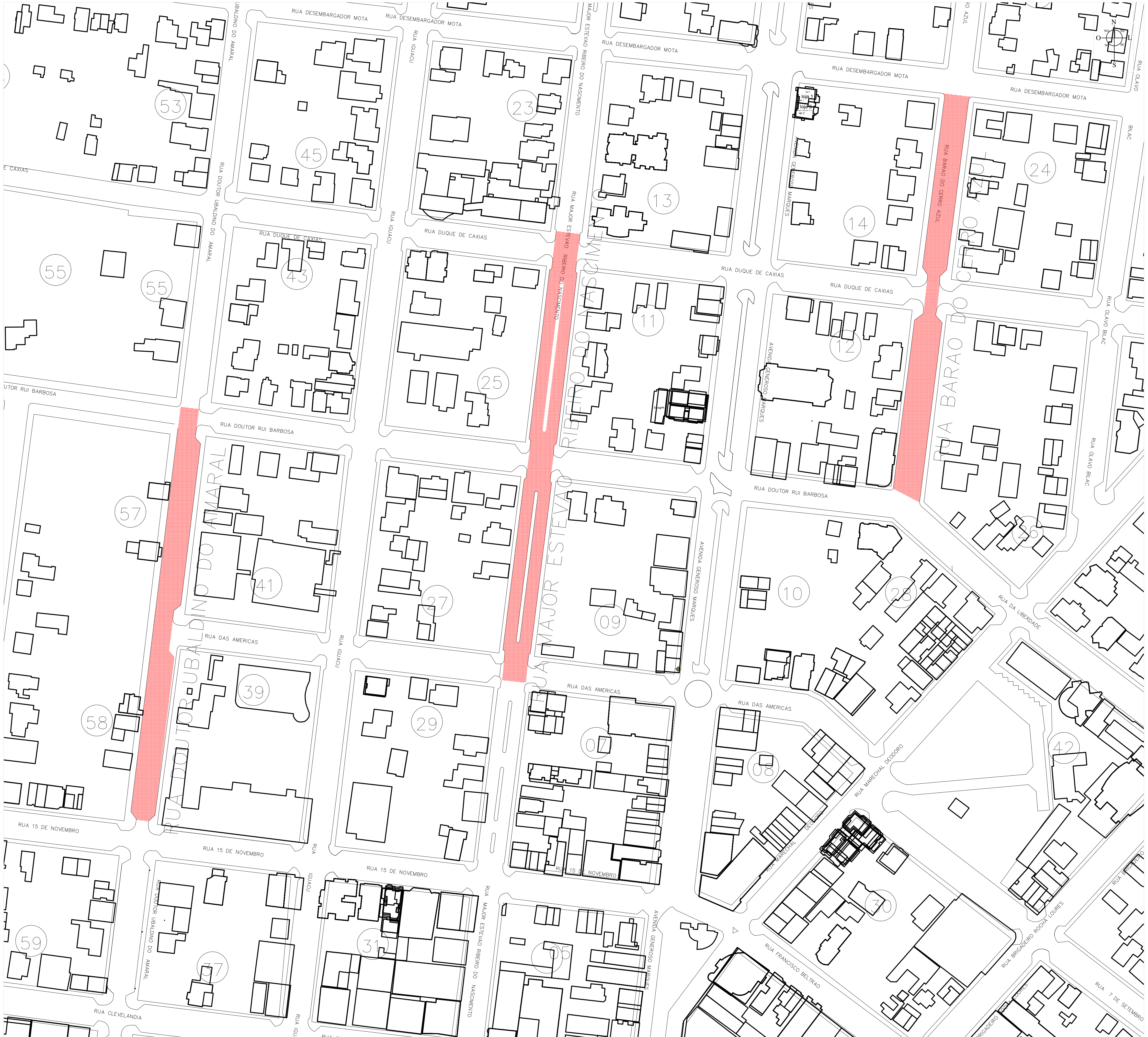
EDIFICAÇÕES - LOTES LINDEIROS Escala: S/E